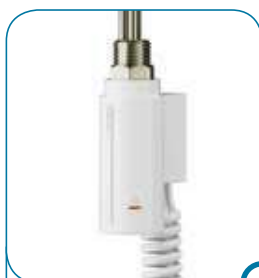
kolor biały C1 colour white C1

It is now available to order a flush-mounted electric heating element. To do so, mark it with a -U at the end of the index of a desired model.