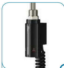
kolor czarny C2 colour black C2