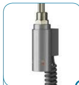
kolor srebrny C3 colour silver C3