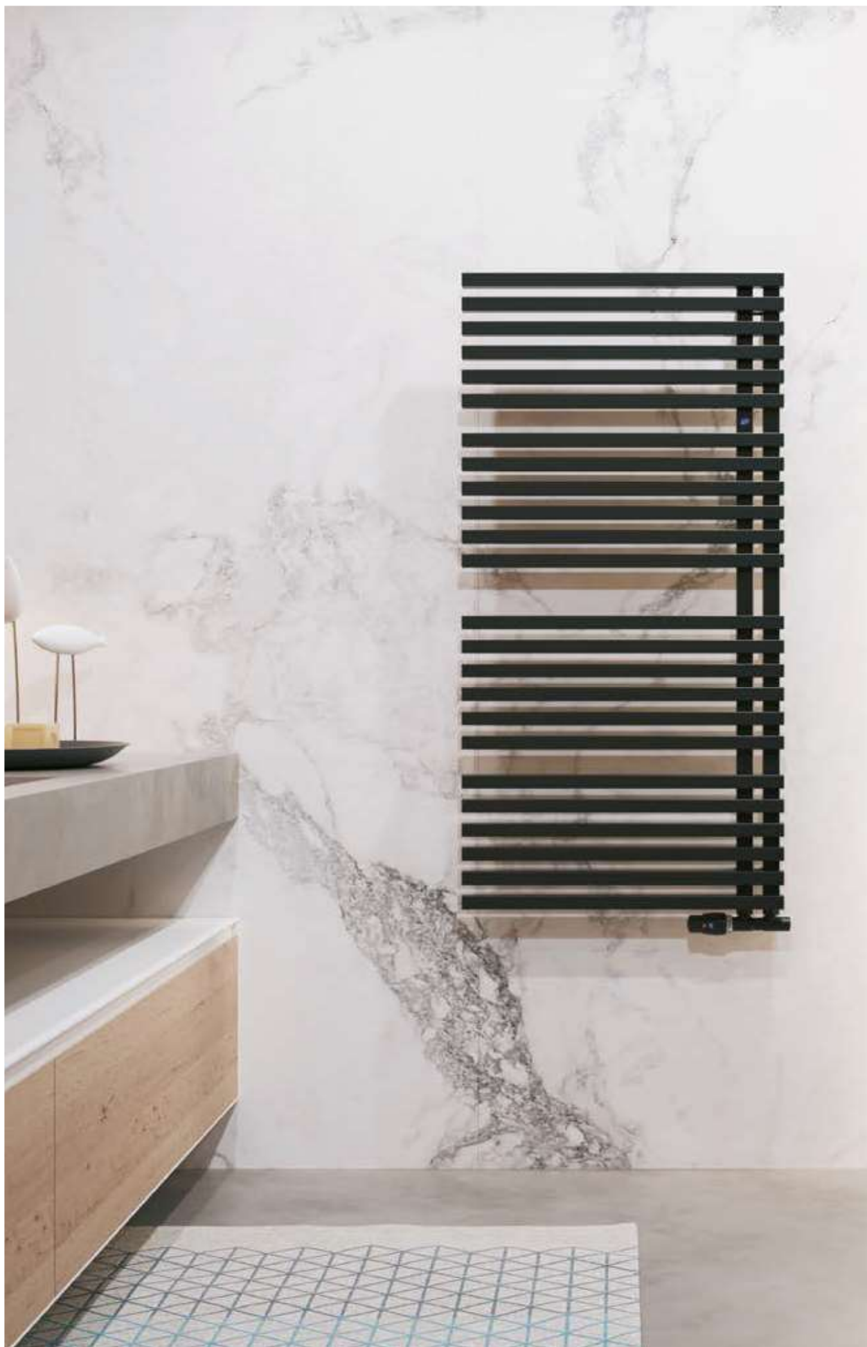
Na aranżacji: grzejnik c.o. GLT-60/120C31, zestaw zaworowy Z15