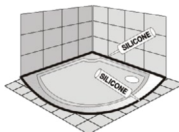
Zapuštěná do podlahy