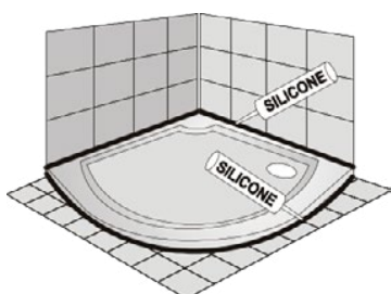
Usazená na podlaze