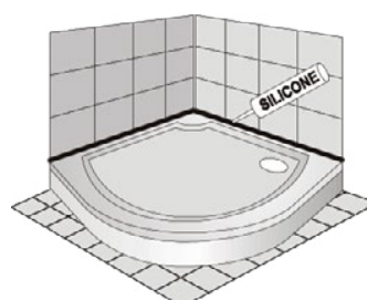
S čelním panelem